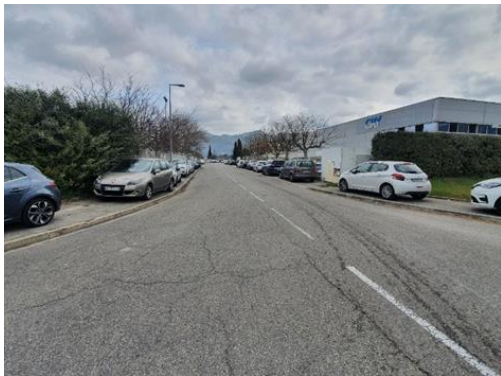
Relevé des stationnements interdits sur voirie